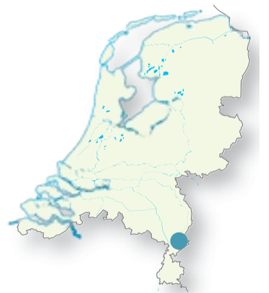
De Cuyperswandeling Roermond is verkrijgbaar bij VVV Roermond, Markt 17, 6041 EL Roermond.