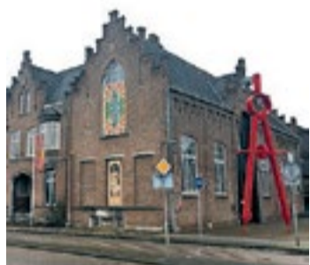
Museum het Cuypershuis.