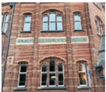
'Nuttige en beeldende kunsten' als opschrift op de Teekenschool.