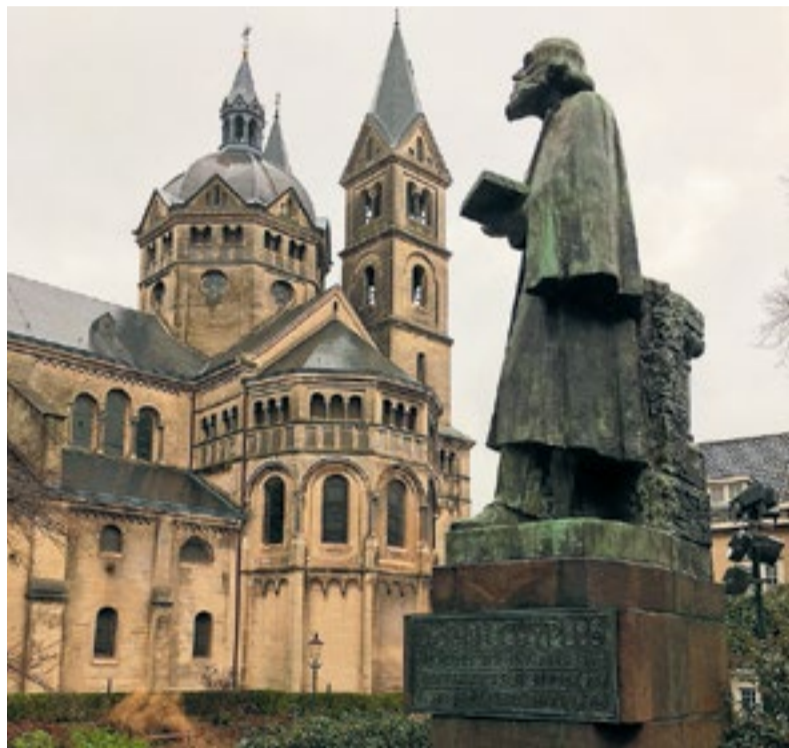
Standbeeld Pierre Cuypers bij de Munsterkerk.

Nederland kent vele duizenden kilometers wandelpad, alle stoepen en steegjes niet meegerekend. Het Nederlands Dagblad zoekt in de vrije natuur, in steden en in dorpen, naar een frisse neus en nieuwe ervaringen. Vandaag: Roermond.