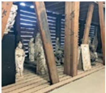
Droogruimte voor beelden in de werkplaats van het Cuypershuis.