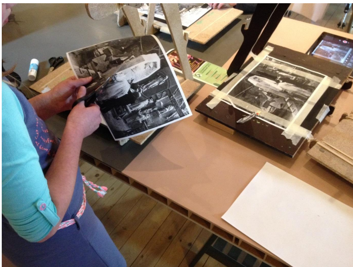
Workshop Stop Motion in de Ambachtsschool